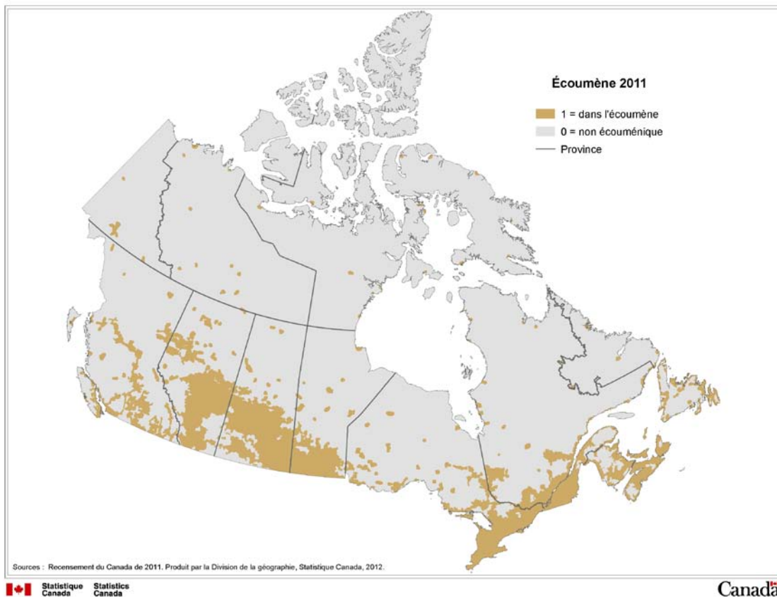
Figure 3.1 Exemple d'un masque d'écoumène avec le Fichier généralisé des limites des provinces et des territoires

Une des limites inhérentes aux applications de cartes choroplèthes est le fait qu'on suppose que la distribution statistique est homogène ou répartie uniformément dans chaque région géographique, ce qui fait qu'elle est représentée par un même ton ou une même couleur dans toute la région. Le recours à l'écoumène limite l'affichage aux régions habitées et permet une représentation plus exacte de la répartition spatiale des données.